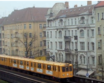
S+U Pankow: Verkehrsknotenpunkt mit vielen Anschlüssen in Berlins City – die U2 fährt am Wochenende auch nachts. In allen übrigen Nächten wird die U2 durch den Nachtbus N2 ersetzt.